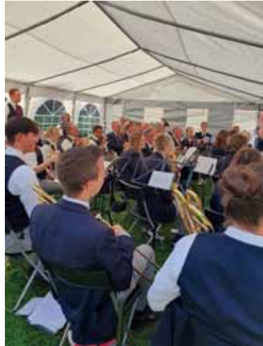
Der Musikverein Olpe mit vielseitigem Repertoire

Der Erlös geht an die Kinder- und Jugendarbeit in Delling.