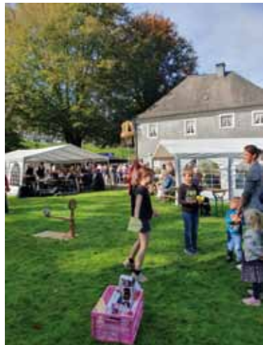
Die Schokokußmaschine war sehr beliebt.